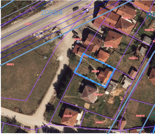
ortofoto sa prikazom građevinske parcele