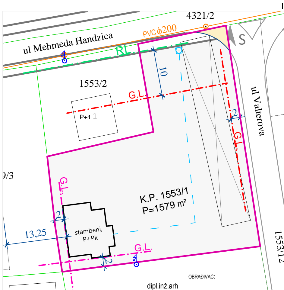
IZVOD IZ PRVIH IZMJENA I DOPUNA PGR- URBANISTIČKA REGULACIJA I PARCELACIJA ZA ZONE ZA KOJE NIJE PREDVIĐENA DALJA PLANSKA RAZRADA