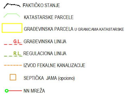
R = 1: 1000

Za ove uslove naplaćena je republička administrativna taksa u iznosu 1890,00 dinara u smislu člana 5, broj 1. Zakona o republičkim administrativnim taksama („Sl. Gl. RS” broj 43/03, 51/03,61/05, 101/05, i dr.Zakon i 5/09, 35/10, 50/11, 70/11, 55/12- usklađeni dinarski iznos, 93/12, 47/13- usklađeni dinarski iznos I 65/13-dr zakon) kao i taksa za izdavanje lokacijskih uslova, tarifni br 8 tač. B u iznosu od 3000,00 din Odluke o opštinskim administrativnim taksama („Opšt.sl.gl.Sjenica, br 6/2015) Naknada za usluge centralne evidencije objedinjene procedure naplaćena je u