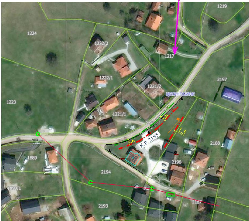
DEFINISANJE POLOŽAJA OBJEKTA, KAO I PRIKLJUČENJA NA INFRASTRUKTURU